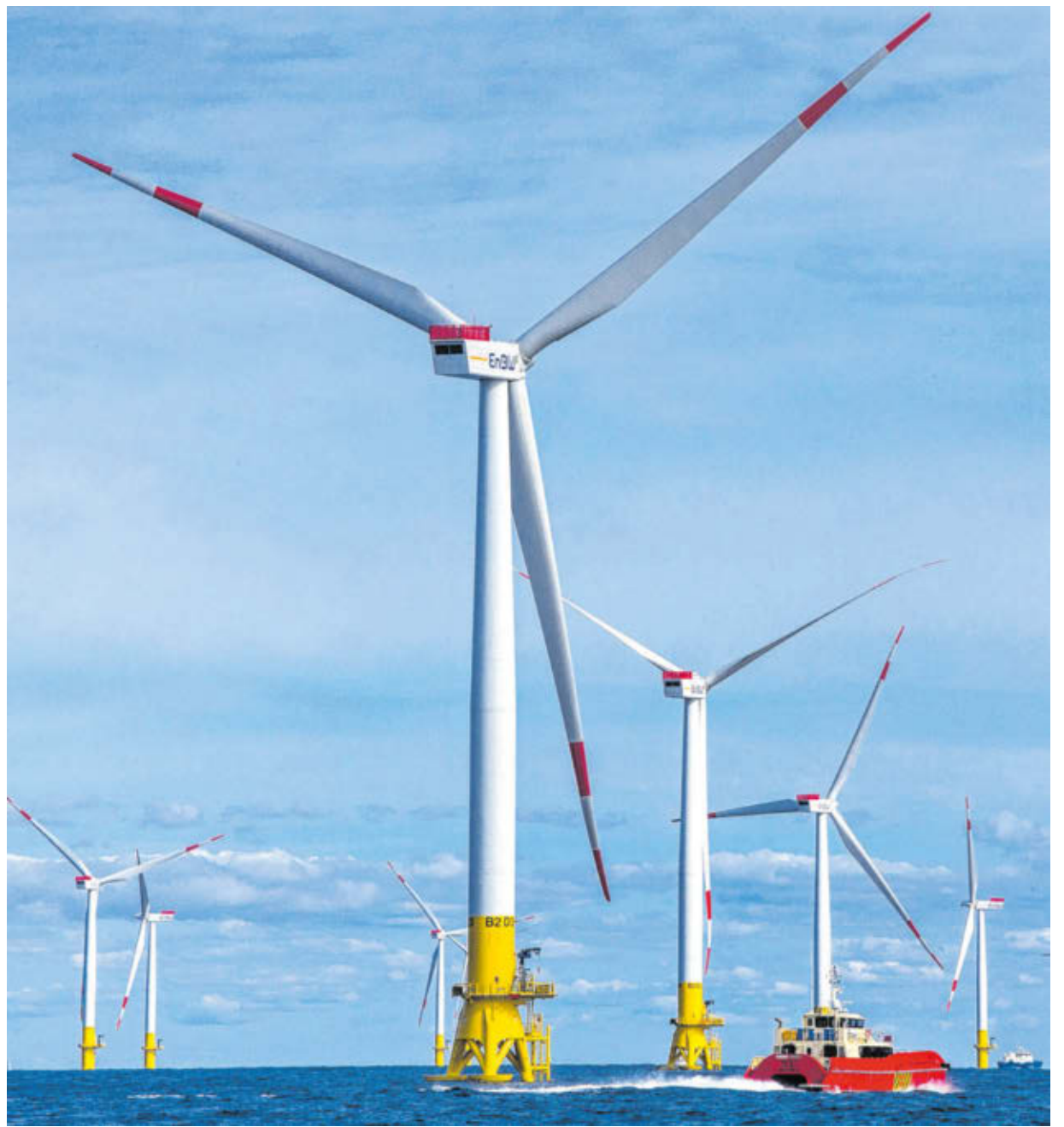
Windräder des Offshore-Windparks Baltic 2 sind in der Ostsee vor der Insel Rügen zu sehen.

gungen müssten so angepasst werden, dass auch kleinere Küttur davon profitieren. Die Parlamentarier hatten sich seit Montag mit der Situation der Fischer in MV befasst. Sie besuchten u.a. das Fischwerk in Sassnitz und das Thünen-Institut in Rostock.